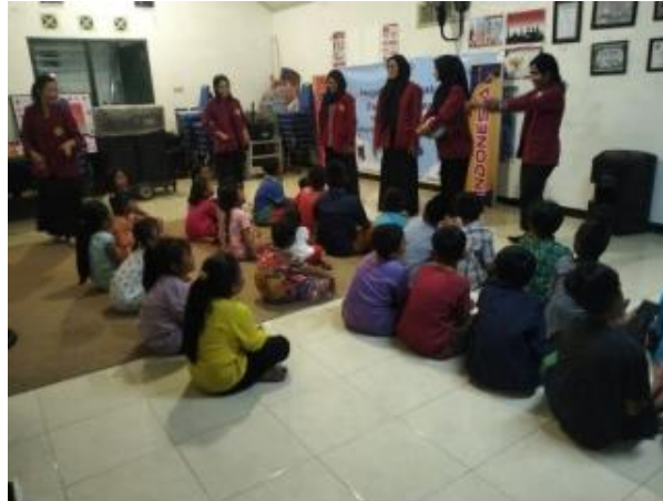
Gambar 4. Saat melakukan Sosialisasi Program dan Penyuluhan pentingnya berwirausaha

Menurut (Saragih, 2017:24) kewirausahaan adalah kemampuan kreatif dan inovatif dan teliti melihat peluang serta selalu terbuka untuk menerima setiap masukan dan perubahan yang positif yang mampu membawa usahanya terus berkembang. Anak usia dini adalah kumpulan orang-orang yang sedang berkembang dan maju. Pada usia itu, para ahli menganggapnya usia yang cemerlang, yang hanya bisa terjadi sekali dalam kemajuan kehidupan manusia (Suryana & Desmila, 2022:4795). Kreatifitas merupakan kemampuan untuk menghadirkan gagasan atau ide dalam memecahkan persoalan saat menghadapi peluang. Dengan adanya kreatifitas maka seseorang akan terdorong untuk mencapai target yang ditentukan. Target yang dimaksud dapat berupa target dibidang apapun termasuk dalam bidang kewirausahaan. Sehingga kemampuan beraktifitas dapat digunakan untuk melahirkan berbagai ide-ide bisnis yang sesuai dengan peluang yang ada. Apabila kreatifitas ditingkatkan, maka akan mendorong peningkatan pada minat berwirausaha (Mahanani & Sari, 2018:766).