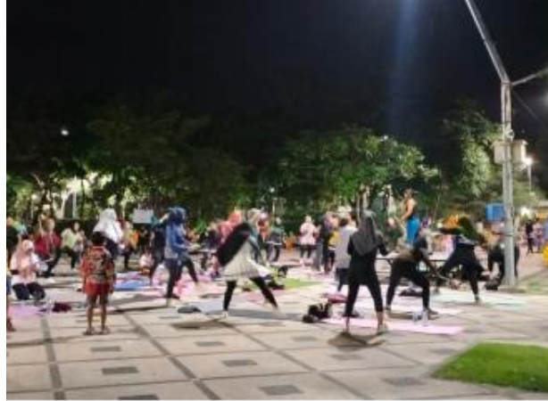
Gambar 6. Kegiatan senam poundfit

Untuk mengatasi kendala tersebut warga Kampung Pancasila mencari jalan keluar dengan cara mencari waktu yang sinkron dimana tidak ada yang berkeberatan pada saat pelaksanaan program di kampung pancasila ini.