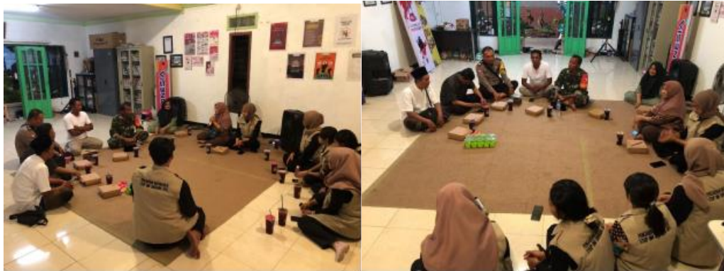
Gambar 7. Monitor dan Evaluasi

Pada tahap ini pengurus TBM, Tim aparat, karang taruna, dan tim pengabdian masyarakat melakukan evaluasi mengenai kegiatan-kegiatan yang telah dilaksanakan selama 6 hari di TBM Babat Jerawat RW 02.