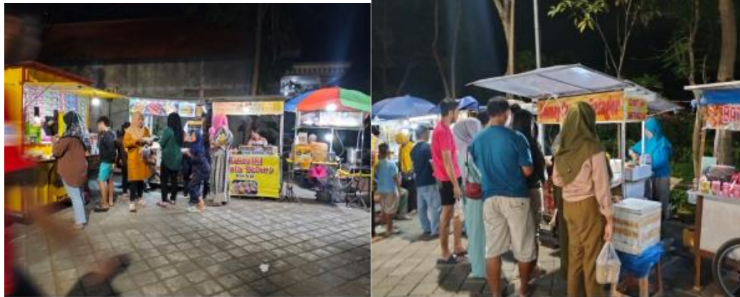
Gambar 5. Kegiatan UMKM dimalam hari

lingkungan atau lokasi dan tempatnya yang sangat nyaman sehingga bisa mendapatkan inspirasi di TBM ini, bisa juga digunakan program kewirausahaan.