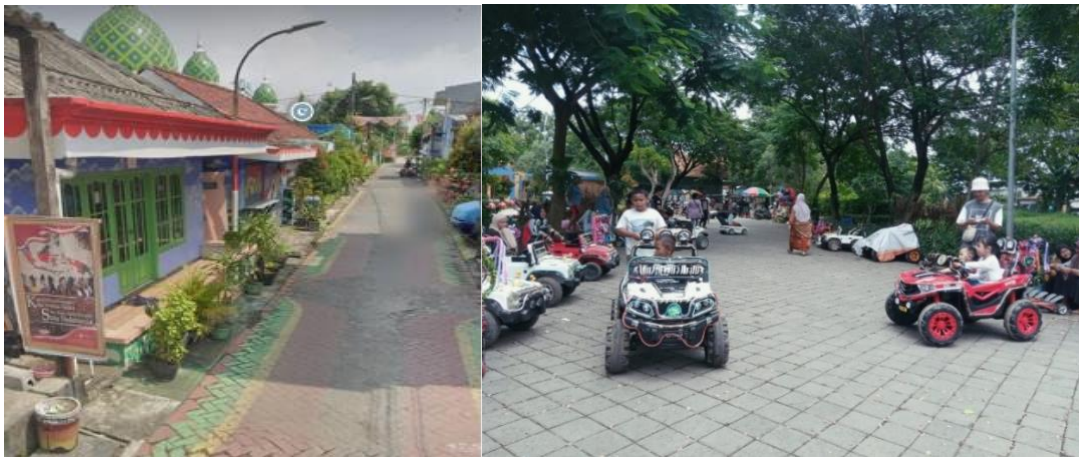
Gambar 1. Survei dan observasi daerah sasaran

Pengabdian masyarakat merupakan pelaksanaan pengamalan ilmu pengetahuan, teknologi dan seni budaya langsung pada masyarakat secara kelembagaan melalui metodologi ilmiah sebagai penyebaran Tri Dharma pengaruh tinggi serta tanggung jawab yang luhur dalam usaha mengembangkan kemampuan masyarakat, sehingga dapat mempercepat laju pertumbuhan tercapainya tujuan pembangunan nasional. Sejatinya kegiatan pengabdian kepada masyarakat adalah manifestasi atas ilmu pengetahuan yang dimiliki. Dengan kata lain, sebuah kewajiban moral atas seseorang yang memiliki kemampuan (pengetahuan dan finansial) untuk membantu sesama (Junaid & Baharuddin, 2020:11). Opsi menjadikan TBM sebagai mitra perpustakaan yaitu pada TBM terdapat beberapa masyarakat yang memiliki motivasi tinggi dalam belajar utamanya peningkatan literasi dan pemahaman baca, sehingga diharapkan pustakawan perpustakaan dapat berbagi ilmu mengenai kewirausahaan dengan sasaran belajar di TBM tersebut. TBM dapat diartikan sebagai lembaga pendidikan nonformal yang kinerjanya lebih fleksibel (Savitri dkk., 2020:125).