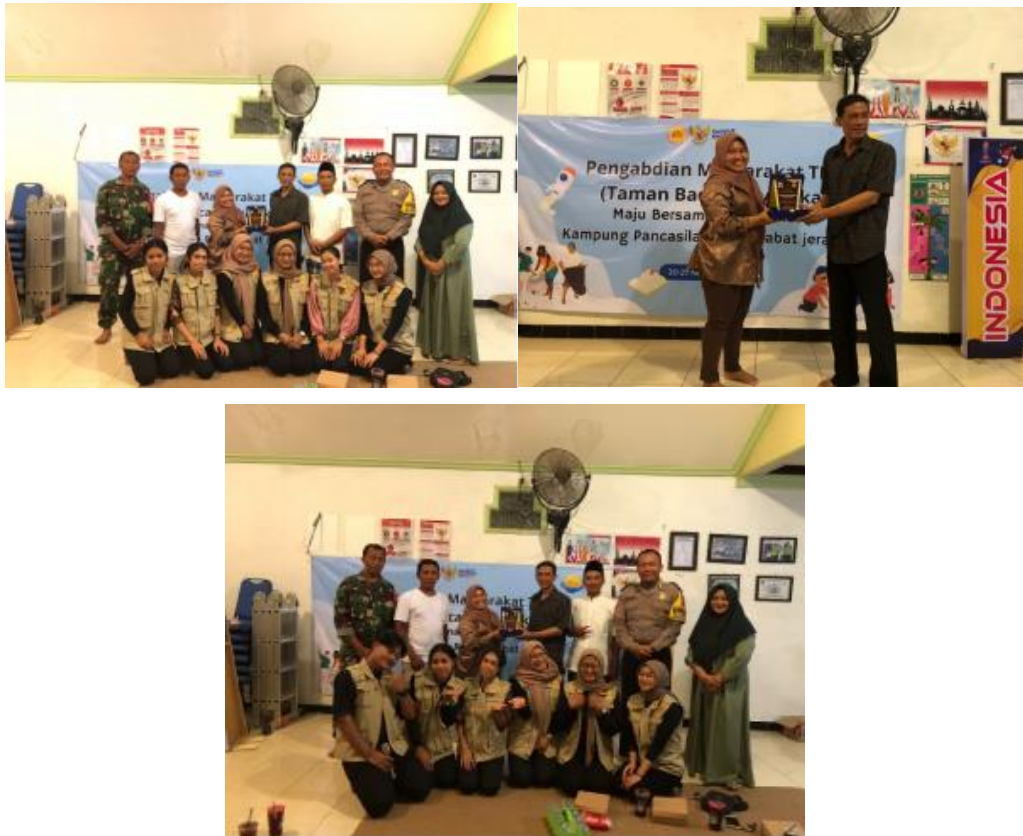
Gambar 8. Penyerahan dan Laporan akhir

Pada tahap ini pengurus TBM, Tim aparat, karang taruna, dan tim pengabdian masyarakat melakukan evaluasi mengenai kegiatan-kegiatan yang telah dilaksanakan selama 6 hari di TBM Babat Jerawat RW 02.