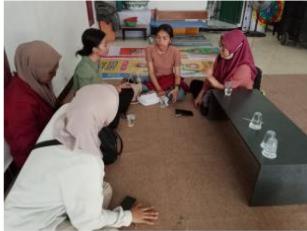
Gambar 2. melakukan Penyusunan Program

Dalam penyusunan program ini ada beberapa kegiatan yang dilaksanakan yaitu, praktik sosialisasi pentingnya berwirausaha, praktik menciptakan kewirausahaan, melaksanakan sinau bareng, Ikut serta dalam kegiatan masyarakat, membuat ketrampilan, senam lansia, pelatihan dan pendampingan dalam menumbuhkan jiwa kewirausahaan. Pelaksanaan kegiatan yang dilakukan dapat dikatakan berjalan dengan lancar tanpa hambatan dan rintangan. Masyarakat dan anak-anak desa Babat Jerawat sangat antusias dengan adanya kegiatan ini. Pemberian stimulasi yang tepat diharapkan dapat mengembangkan potensi anak secara optimal. Dalam sebuah penelitian dijelaskan, menumbuhkan semangat berwirausaha diperlukan upaya banyak pihak, khususnya diri sendiri. Maka, sangat tepat jika sejak dini memperkenalkan kewirausahaan kepada para remaja atau anak-anak. Baik melalui kegiatan belajar atau ikut berdagang dengan orang lain (pengusaha). Hal tersebut secara perlahan akan membentuk mental usaha, yang pada waktunya akan mendorong orang untuk menjadi pelaku usaha (Ismail, et, al., 2020:12).